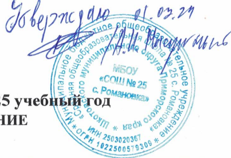
ГРАФИК оценочных процедур на 2024-2025 учебный год НАЧАЛЬНОЕ ОБЩЕЕ ОБРАЗОВАНИЕ I полугодие

Приложение № 4 к приказу № 95-А от 01.07.2024 г.