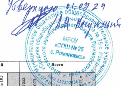
ГРАФИК оценочных процедур на 2024-2025 учебный год СРЕДНЕЕ ОБЩЕЕ ОБРАЗОВАНИЕ II полугодие