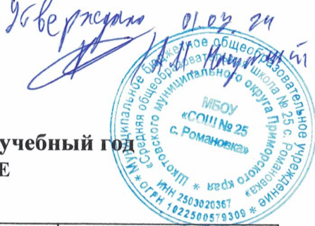
ГРАФИК оценочных процедур на 2024-2025 учебный год ОСНОВНОЕ ОБЩЕЕ ОБРАЗОВАНИЕ I полугодие

Приложение № 5 к приказу № 95-А от 01.07.2024 г.