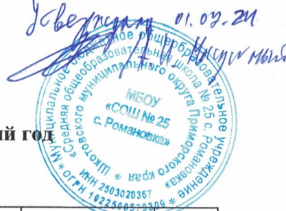
ГРАФИК оценочных процедур на 2024-2025 учебный год СРЕДНЕЕ ОБЩЕЕ ОБРАЗОВАНИЕ I полугодие

Приложение № 6 к приказу № 95-А от 01.07.2024 г.